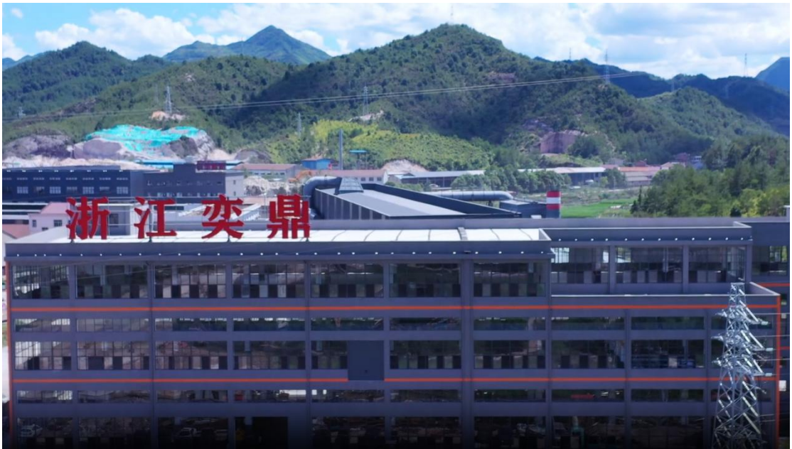
图 1 公司厂区图

公司采用废钢为原材料的短流程生产工艺,集冶炼、精炼真空脱气、电渣重熔、锻造、轧钢、精整、机加工等生产流程为一体,装备了目前最先进的生产技术设备,产品具有高质、稳定、节能、环保的特性。公司以“质量为先,客户至上,务实创新,持续发展”的经营理念赢得了客户的信任和良好的市场份额,打造一支创新服务一体化的专业队伍,力争开拓成为同行业规模化一流企业,竭诚与本公司工模具用户创造合作共赢的共同体。